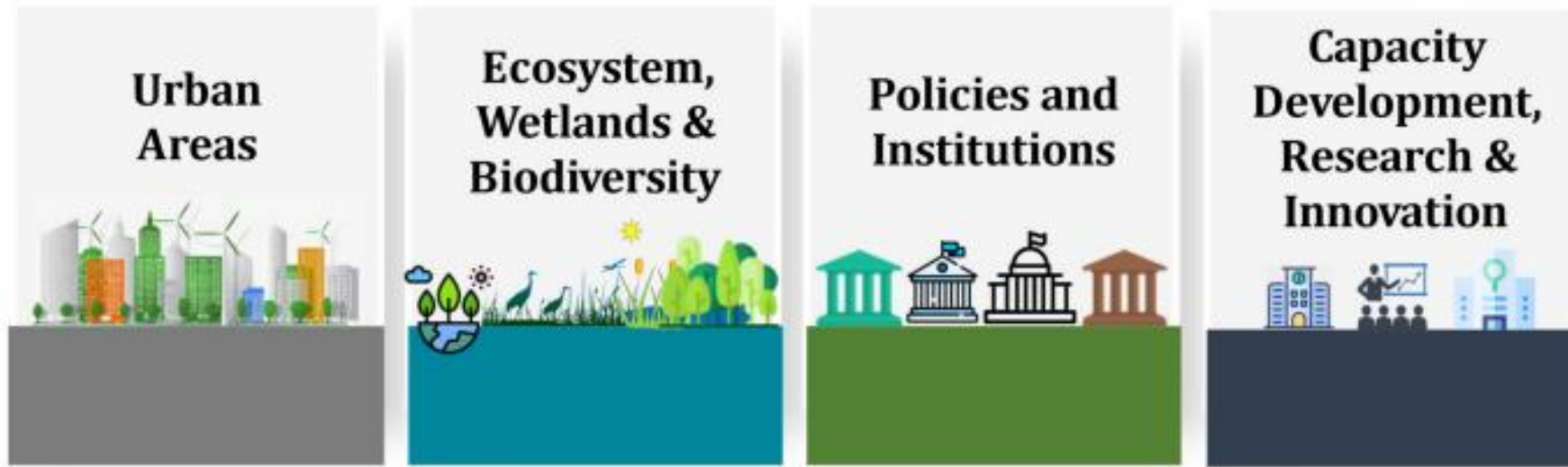
Sectors of NAP